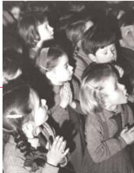
Las organizaciones dicen que la nueva ley de educación debe desterrar definitivamente el adoctrinamiento de los centros públicos.

Las organizaciones que impulsan la campaña "Por una sociedad laica. La religión fuera de la escuela" exigen al Gobierno que apoye la decisión del Consejo Escolar del Estado, máximo órgano consultivo en materia de enseñanza no universitaria, que el pasado 21 de febrero pidió la retirada de la asignatura de religión del horario lectivo y la denunciade los Acuerdos con el Vaticano, suscritos en 1976 y 1979, pues violan derechos fundamentales de las personas.