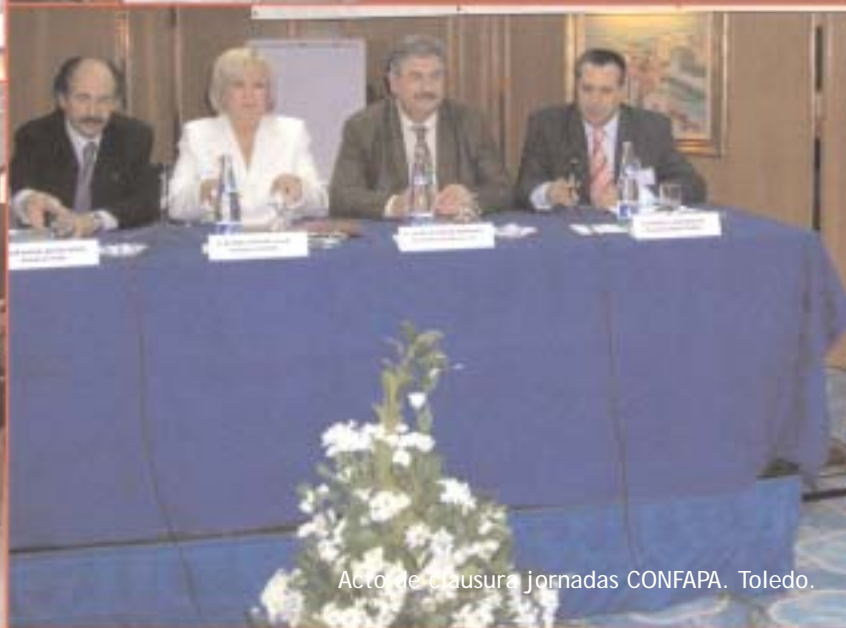
Acto de clausura jornadas CONFAPA. Toledo.