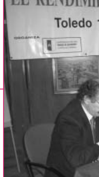
Mesa de clausura de las Jornadas sobre rendimiento escolar celebradas en Toledo los pasados días 19, 20 y 21 de noviembre de 2004.

Para analizar los factores que influyen en el rendimiento escolar, la motivación de alumnos y alumnas así como los planes para intentar mejorar la ESO, tuvo lugar, en Toledo, el pasado día 19 de noviembre, un Encuentro Regional organizado por la Confederación de APAS, Miguel de Cervantes, de Castilla La Mancha, con el objetivo de analizar, en libertad, la situación actual e intentar aportar algunas soluciones.